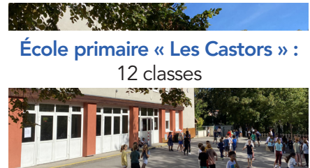
École primaire « Les Castors » : 12 classes

Les écoles de Bièvres bénéficient d'une situation privilégiée. Elles sont situées dans un environnement calme et vert et à proximité de toutes les installations à vocation sociale, culturelle et sportive.