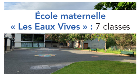
École maternelle « Les Eaux Vives » : 7 classes